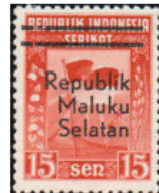
Timbres surchargés : Republik Maluku Selatan