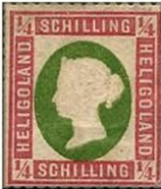
¼ schilling de Hambourg

Bien que la Poste d'Helgoland fut très liée à l'administration postale de Hambourg , ces timbres ont été imprimés par la Poste de la Prusse à Berlin (devenue après l' unification de l'Allemagne la Reich Druckerei).