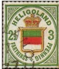
3 Pfennig (Allemand) 2,5 Farthing (Britannique)