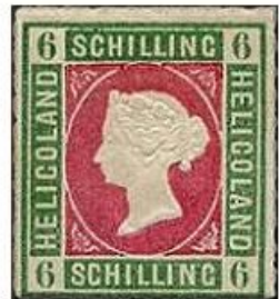
6 Schilling de Hambourg

Helgoland est probablement le premier cas historique d'action humanitaire mais aussi d' escroquerie par la philatélie .