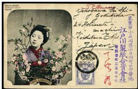
Carte postale japonaise publiée à Tokyo en 1904

Les illustrations des cartes postales suscitent leur collection par thèmes (les métiers, les villages d'un département etc.), par usage (envoyées par les soldats depuis le front).