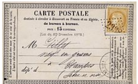
Une carte postale officielle de 1874, recto.

Le 19 décembre 1872 , la loi de finance , sur proposition du député Louis Wolowski , introduit en France de façon officielle la carte postale. L'utilisation de la carte postale officielle n'intervient, en France, qu'à partir du 15 janvier 1873 .