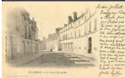
Une carte postale de 1903, verso.

La carte postale passe occasionnellement à la couleur et adopte la photochromie, elle acquiert alors une notoriété considérable avec l'exposition universelle de 1900 à Paris, où les tirages, coûteux, peuvent être rentabilisés de fait de l'affluence. Elle va connaître un âge d'or, jusqu'à la fin de la Première Guerre mondiale.