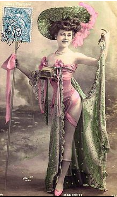
« Marinett » des Folies Bergères , un cliché de la société fondée par Waléry, ici colorisé (imprimé par la S.I.P., date du tampon postal : 1905).

Une croissance admise à l'époque comme le remède à tous les maux. Une croissance qui a mis en mouvement l'ascenseur social. Mais une croissance qui a nécessité un exode rural et éloigné une grande partie de la population de ses racines. Quand la machine se grippe, il faut revenir aux vraies valeurs. L'intérêt pour la carte postale s'inscrit dans ce cadre-là. Elles sont les derniers témoins d'un monde disparu car elles ont su arrêter, un instant, le temps qui passe vraiment trop vite.