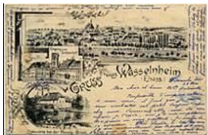
Grüss aus Wasselnheim, de l'imprimeur alsacien Pie Ott à Wasselonna vers 1890

C'est à cette époque que l'imprimeur Neurdein va éditer des cartes pour chaque ville importante de France, et qu'Albert Bergeret, dès 1898, va produire des cartes illustrant l'Est de la France.