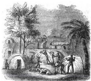
BUILDING AN AFRICAN KRAAL.