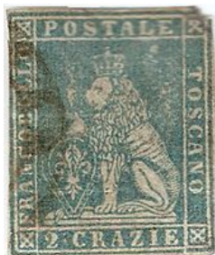
2 crazie de 1851