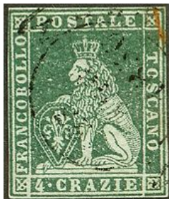
4 crazie de 1851

La Toscane émet ses premiers timbres le 1 er avril 1851. Le sujet représente un lion couronné qui pose la patte sur un bouclier décoré par un motif de fleur de lys. Cette série est connue sous le nom de Marzocco 7 . Il est inspiré de la sculpture de Donatello qui se trouve sur la Piazza della Signoria à Florence.