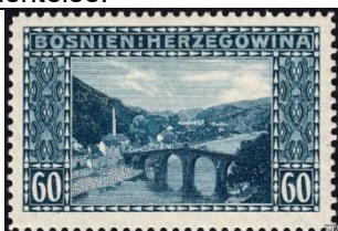
Konjic et pont sur la Neretva