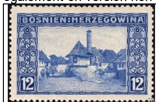
Vue de Jajce