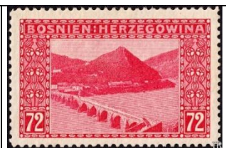
Visegrad et pont sur la Drina

Politique oblige, tous les timbres illustrés sont retirés vers la fin de 1912 et remplacés par une série de portraits de l'empereur, fruit d'une autre collaboration entre Moser et Schirnböck. Ici aussi, les bandeaux latéraux inspirés de l'Art nouveau diffèrent pour chacune des vingt valeurs. Ces timbres, de deux tailles différentes) comportent